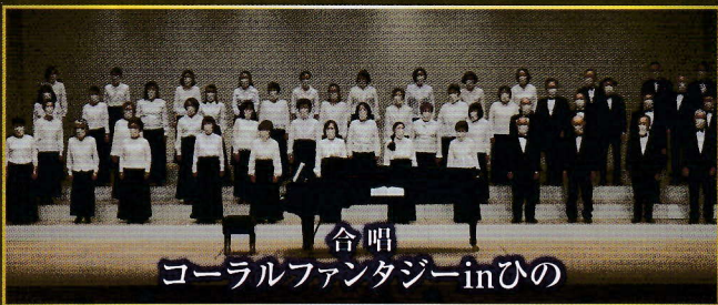
合唱 コーラルファンタジーinひの