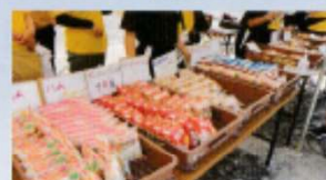
(写真は現在のものです)