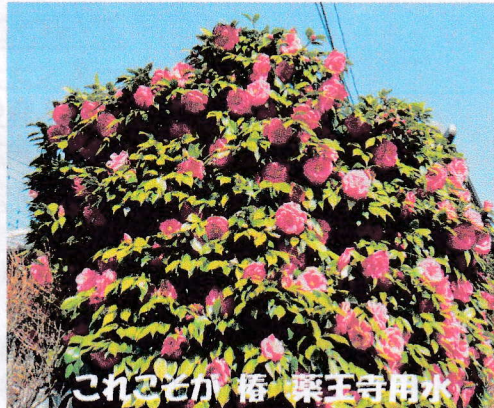
これこそが 春 薬王寺用水