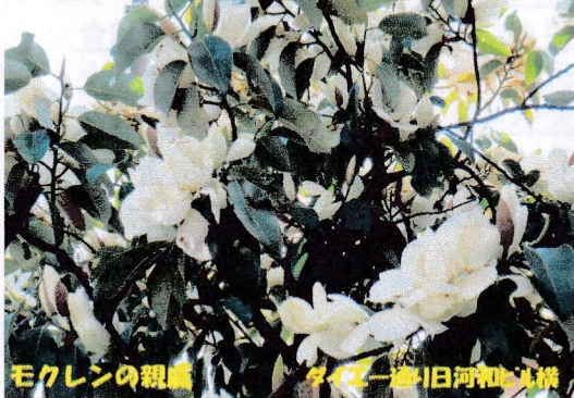
モクレンの親戚 タネ一途旧河津山見橋