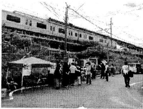
日野駅西日野煉瓦橋

また、日野駅ポイントでは、ロシアによるウクライナ侵攻にともなう難民の皆さんへの人道支援を目的とした募金活動を合わせて行いました。募金額は29,246円でしたが、振込の都合で3万として国連難民高等弁務官事務所に寄付させていただきました。ご協力いただきました皆さん誠にありがとうございました。