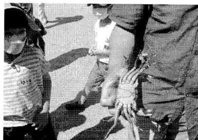
かなり大きなモクズガニにびっくり!

なお、今回捕まえた生き物は、モクズガニのほか、カマツカ・カワムツ・オイカワ・ザリガニ・ヤゴ・スジエビ・カワニナなどでしたが、今年もバスが捕獲されたので、こちらは可哀想でしたが処分し、そのほかの生き物はすべて用水に放しました。