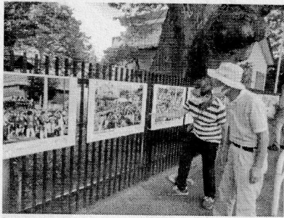
八坂神社裏のフェンス

未だにコロナ感染に翻弄され続ける状況ですが、このひと月、懐かしい祭りの写真をご覧いただき少しでも気を紛らわしていただけたとしたら幸いです。